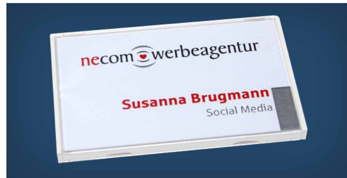
vista® classic XL

Noodzaak, effect en leesbaarheid zijn de criteria bij uw keuze van de uiteindelijke informatie op de naambadge! Voornaam, achternaam en bedrijf zijn zonder meer een must. Stel echter wél prioriteiten! Welke informatie is het meest essentieel?